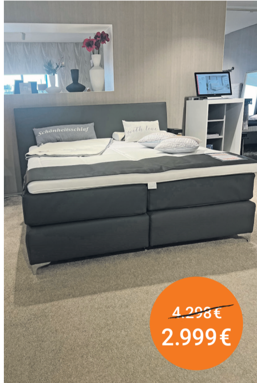
Bett Pure 3C 180/200