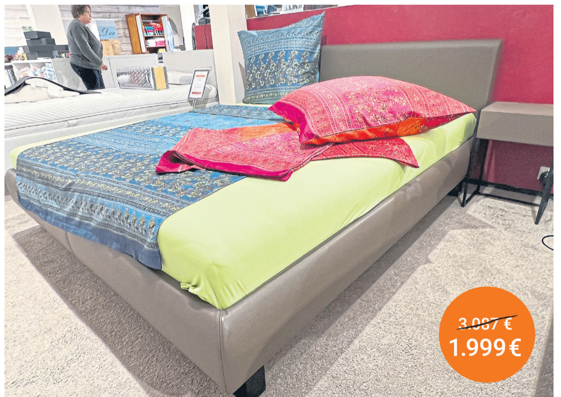
Bett Plaisir von Christiane Kröncke echt Leder 180/200