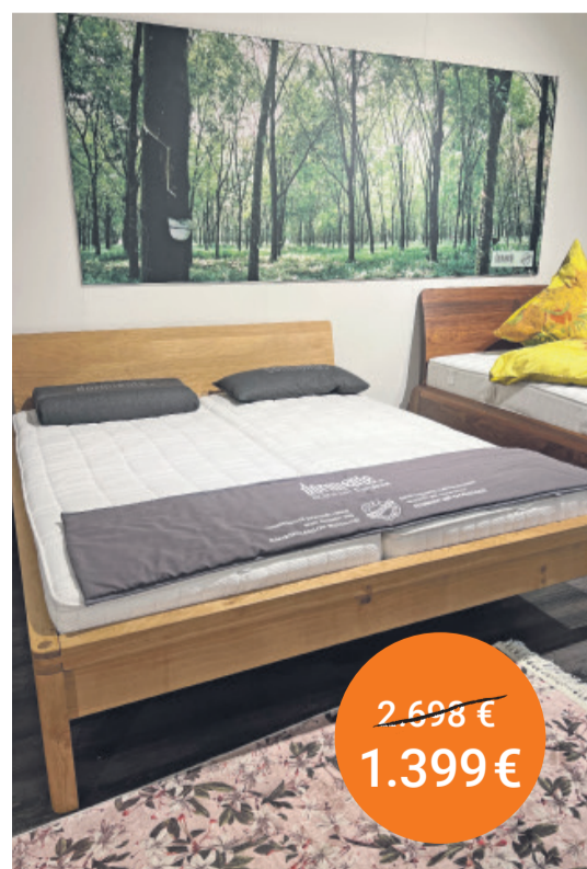
Bett Piu 1 Firma Dormiente 180/200