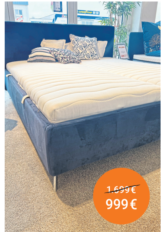
Polsterbett Floris 180/200