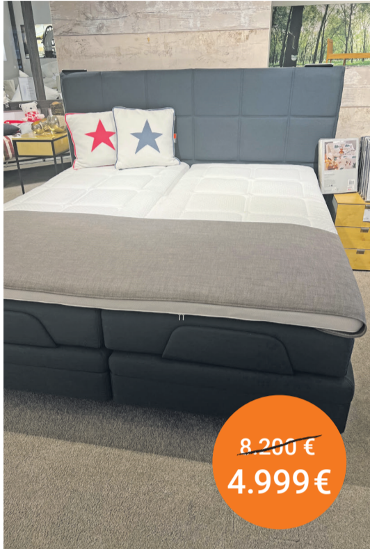
Bett Metropolitan Platinum 180/200

Mondpreise sondern echte Schnäppchen von den führenden Herstellern, und sofort verfügbar! Hier eine Auswahl: (Alle Betten ohne Matratzen und Lattenroste und ohne Deko)