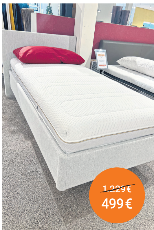
Someo Polsterbett 90/200