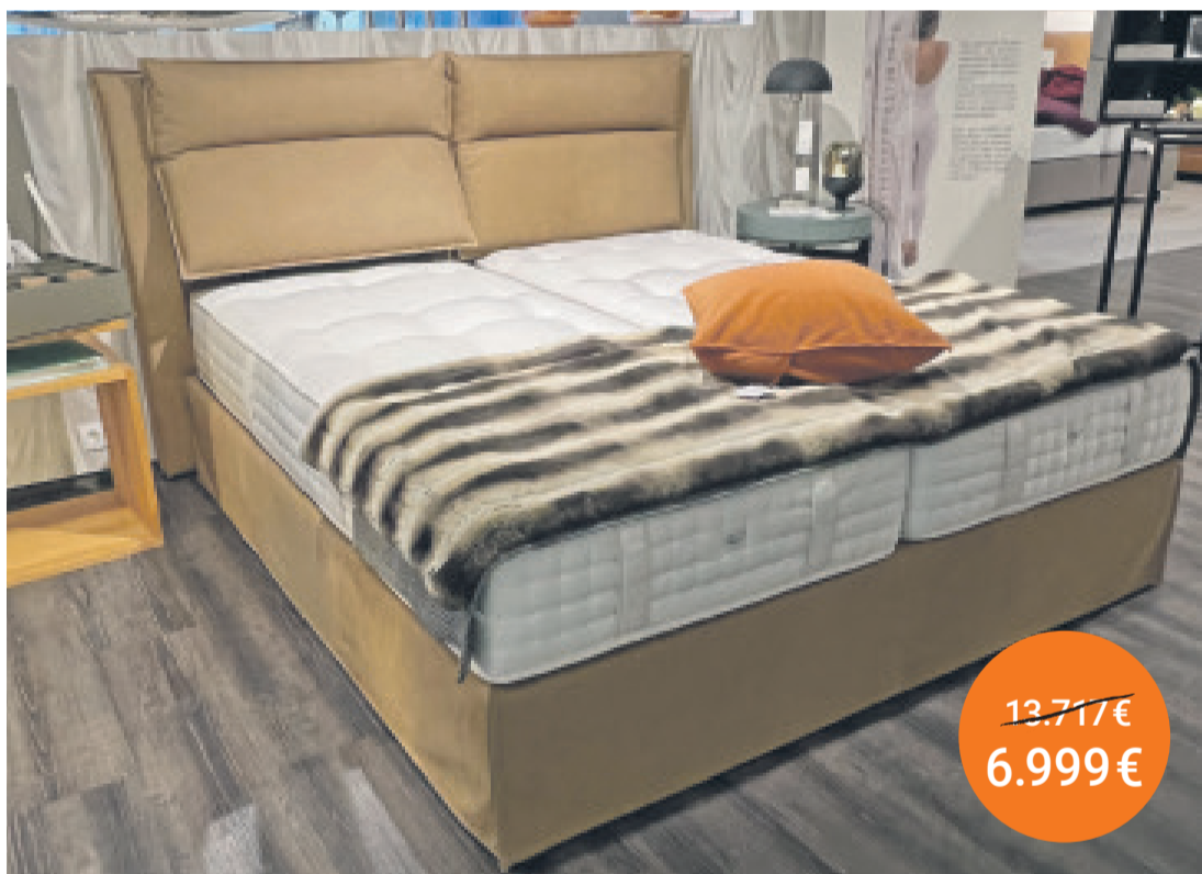
Bett Fold Echt Leder Firma Schramm 180/200