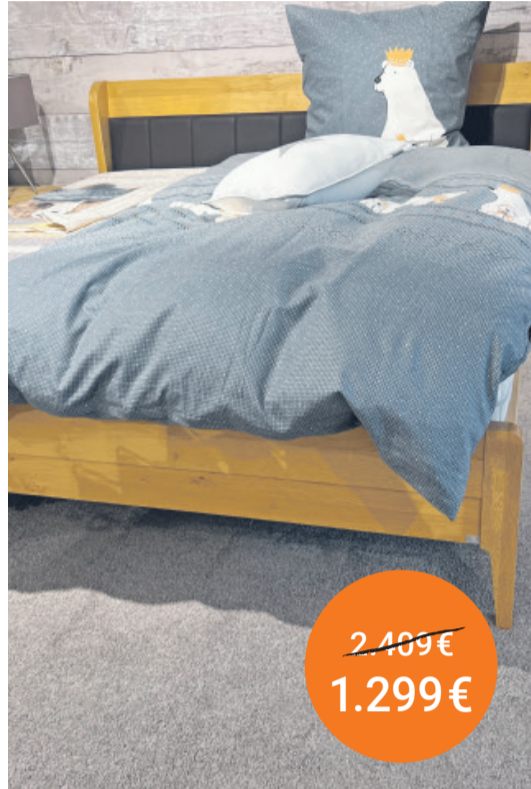
Bett Alcamo Firma Reichert 180/200