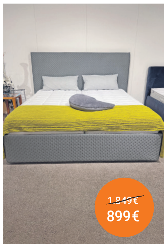
Bett Someo Rössle & Wanner 180/200